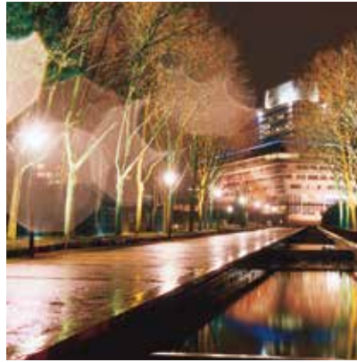
2003 - Cergy - Frankrike