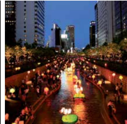
2008 - Seoul - Korea