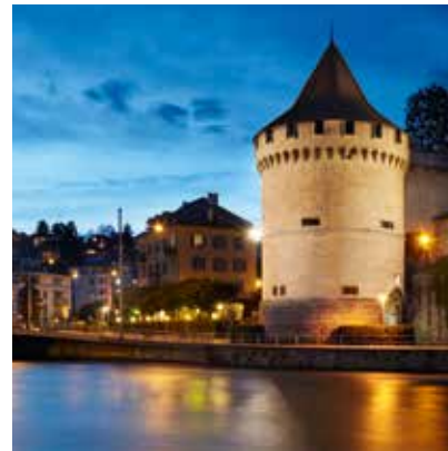
2010 - Lucerne - Sveits