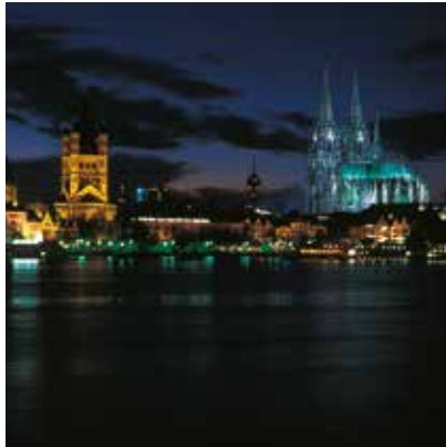
2005 - Cologne - Tyskland