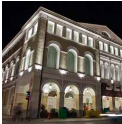
2011 - Valladolid - Spagna