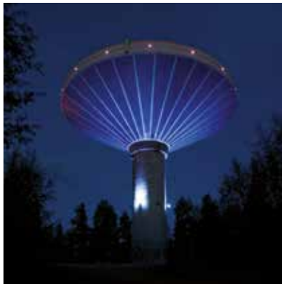
2009 - Jyväskylä - Finlandia