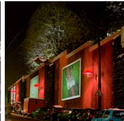
2012 - Lione - Francia