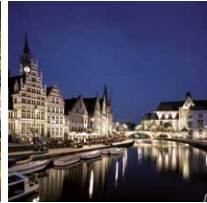
2004 - Ghent - Belgio