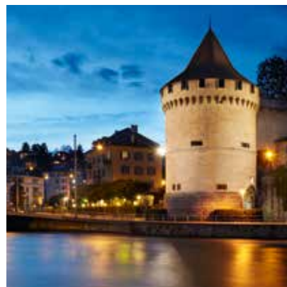
2010 - 卢塞恩 - 瑞士