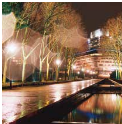
2003 - 塞日 - 法国