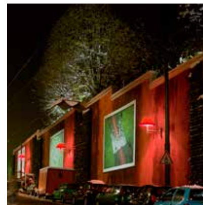
2012 - 里昂 - 法国