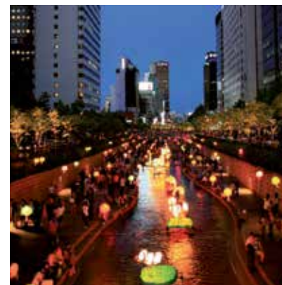
2008 - 首尔 - 韩国