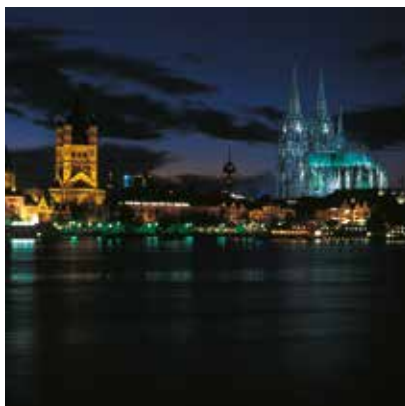
2005 - 科隆 - 德国