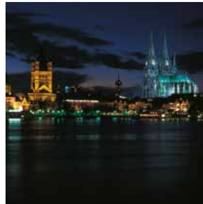
2005 - Köln, Tyskland