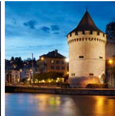
2010 - Luzern, Schweiz