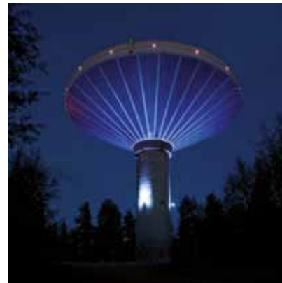
2009 - Jyväskylä - Finland