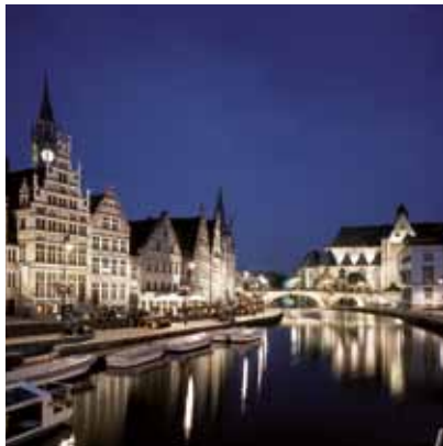
2004 - Gent, Belgien