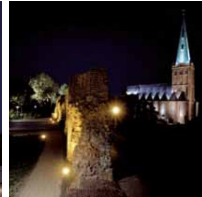
2007 - Heinsberg - Tyskland