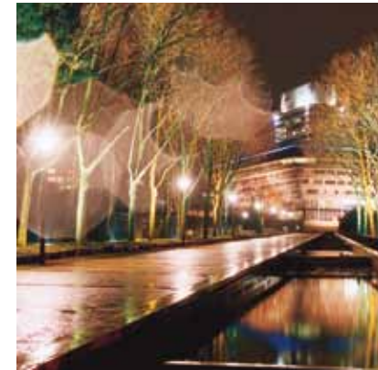
2003 - Cergy - Frankrike