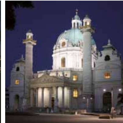
2006 - Vienna - Østerrike