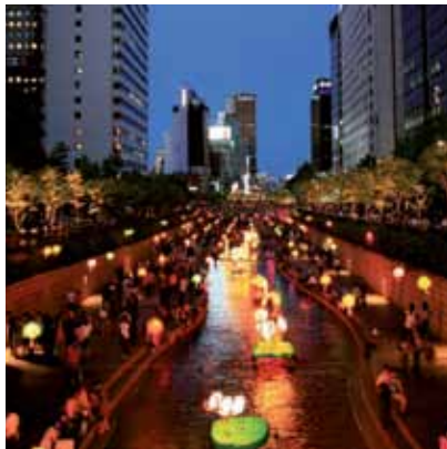
2008 - Seoul - Korea