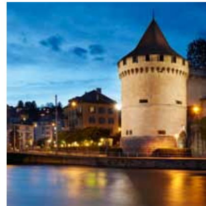
2010 - Lucerne - Svizzera