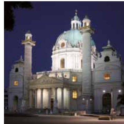
2006 - Vienna - Austria