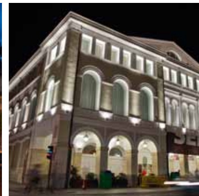
2011 - Valladolid - España