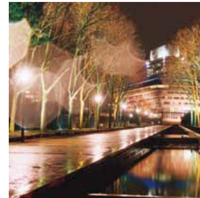
2003 - Cergy - Francia