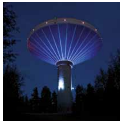
2009 - Jyväskylä - Finlandia