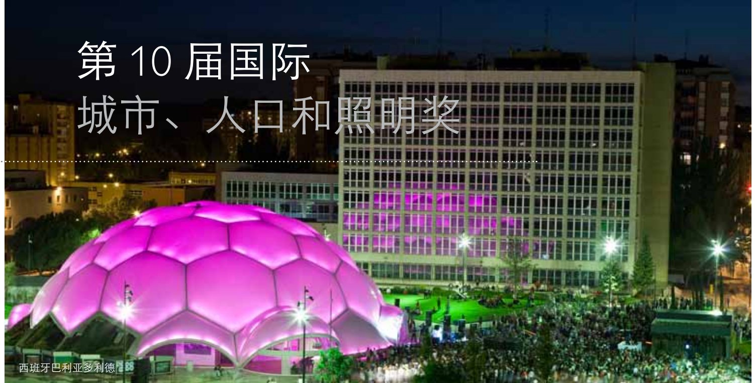
西班牙巴利亚多利德

无论何时何地，照明与人们的生活息息相关。过去二十年以来，城市照明已变得不再只是一种确保安全和提供照明那么简单：不管是在大城市还是小城市，灯光已经成为城市规划中不可或缺的部分，也是城市文化特征的主要元素。城市照明能够给城市带来可媲美甚至超过白天景象的夜景。通过改变夜景，可以重新定义居民与城市之间的关系并改善居民的生活环境。