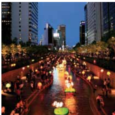
2008 - 漢城 - 韓國