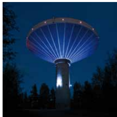
2009 - 於韋斯屈萊 - 芬蘭