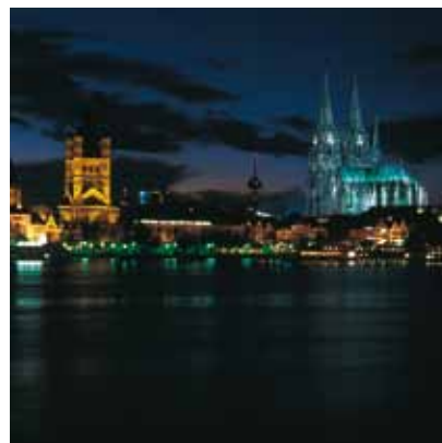
2005 - 科隆 - 德國