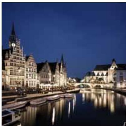
2004 - 根特 - 比利時