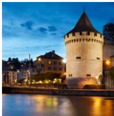
2010 - 盧塞恩 - 瑞士