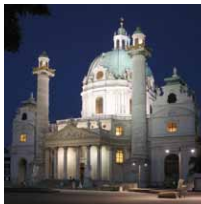
2006 - 維也納 - 奧地利