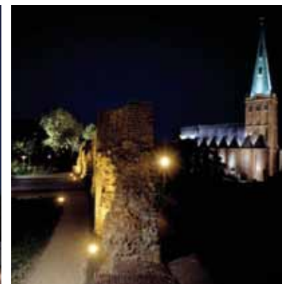
2007 - 海因斯貝格 - 德國